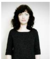
Musique (en alternance) - FANNYTASTIC