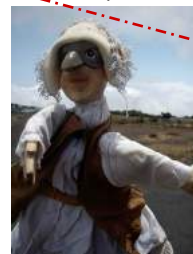
Sous le soleil de la Réunion