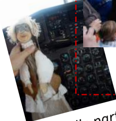
Polichinelle part en voyage