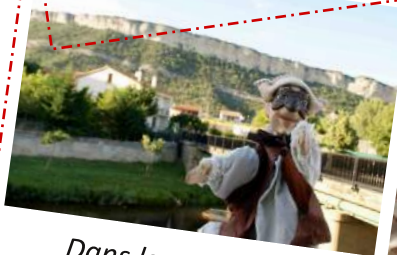
Dans la campagne de Médina de Pomar, en Espagne