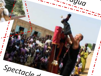
Spectacle dans un village au Sénégal