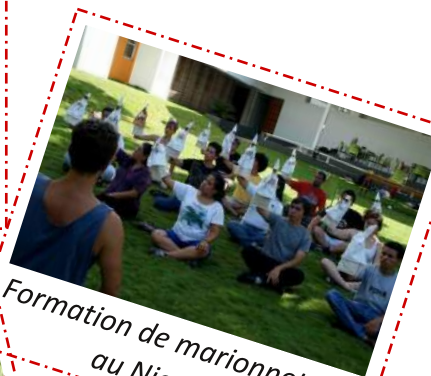
Formation de marionnettistes au Nicaragua