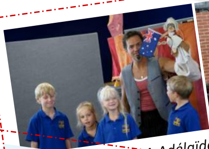
A Adélaïde en Australie