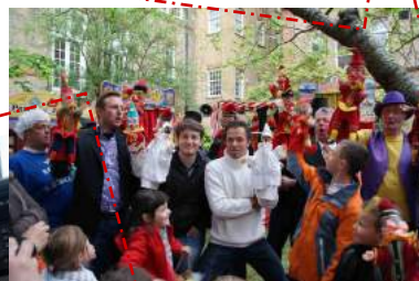
A Londres, au London May Fair, grand rassemblement de Polichinelle et ses cousins